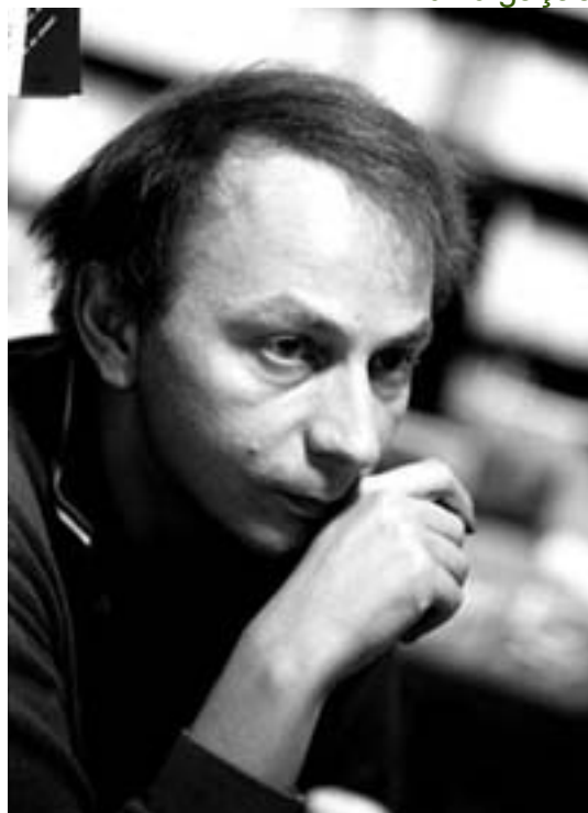
O escritor Michel Houellebecq